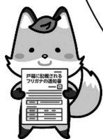
戸籍制度マスコットキャラクター 「コセキツネ」

正しいフリガナが通知された 場合は、 届出をしなくても 、 戸籍に記載されるから安心！