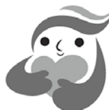
犯罪被害者等支援 シンボルマーク 「ギョつとちゃん」

犯罪の被害者やその家族は、直接的な被害だ けでなく、プライバシーの侵害や配慮のない言 葉など、二次被害にも苦しめられています。被 害を受けた後も、住み慣れた地 域で安心して暮らすためにはみ なさんの理解と温かい支援が必 要です。