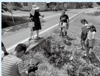
地域の探索の様子