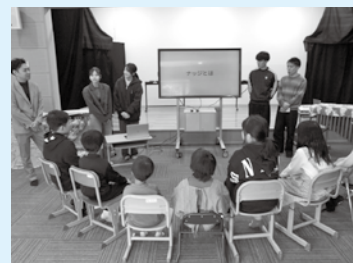
県立大学生による出前授業