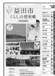
2023年版 益田市くらしの便利帳

【広告に関する問い合わせ先】(株)サイネックス山口支店 ☎ 0834-32-3991