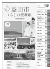
2023年版 益田市くらしの便利帳

市役所の各種手続きや制度・相談窓口などを掲載した「益田市くらしの便利帳」を㈱サイネックスとの官民協働事業で発行します。発行・配布は10月頃を予定しています。