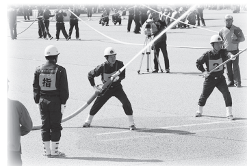
全国消防操法大会(豊川分団)

平常時には防災普及活動の担い手として、災害時には消火や警戒などの活動を行なっています。