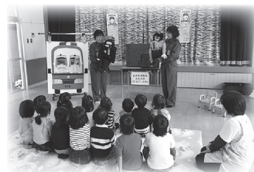
女性も活躍しています