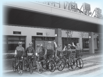
萩・石見空港を出発！