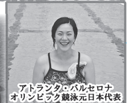
アトランタ・バルセロナ オリンピック競泳元日本代表