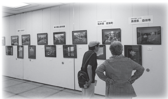
写真展会場の様子