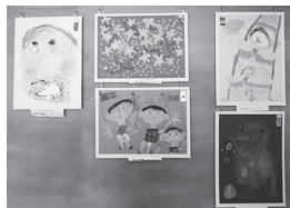
特別雪舟賞受賞作品