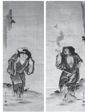
雲谷 等村「蝦蟇、鉄拐仙人図」

花鳥画、山水画と並び東洋画の三大画題に数えられる人物画は、現代でも描かれ続け、親しまれている画題です。本展では、人物にまつわるエピソードとともに、多様な人物画の作品を紹介します。