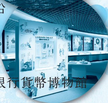
日本銀行貨幣博物館