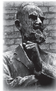
ジョージ・バーナード・ショー

✿ 1995年 シェイマス・ヒーニー (Seamus Heaney/1939-2013/北アイルランド出身) 詩人・作家。クイーンズ大学で学んだのち教職に就く。ハーバード大学教授も務めた。〈代表作〉ナチュラルリストの死 ほか