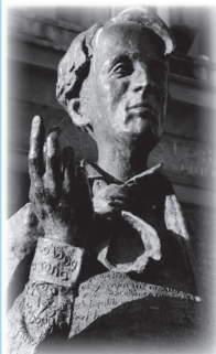
ウィリアム・バトラー・イェイツ

ノーベル文学賞受賞者数は人口比で世界最多 ~北海道の面積ほどの小さな国ながら4名の受賞者を輩出~