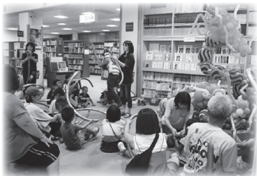
大蛇と剣を作るバルーンワークショップ

8月4日(日)、グラントワと市立図書館を会場に、子育てに関わるさまざまな活動をしている団体を中心に開催され、子どもから大人まで、のべ2,500人が来場しました。グラントワでは音楽劇や赤ちゃんハイハイオリンピック、玉すだれ公演などを、図書館ではものづくり体験や、手作りの食べ物・小物の販売コーナーに出店内容と関連した図書を設置して、楽しみながら本に触れてもらうことができました。