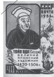
雪舟切手 (ソビエト連邦発行)