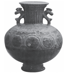
雪舟焼「龍耳刻文花瓶」