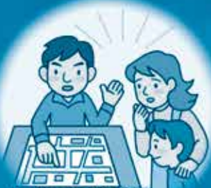
家族で危険箇所、避難場所を確認!

お住まいの町のハザードマップで、危険な箇所、避難場所、避難経路を確認しておきましょう。防災情報や避難情報に注意して、早めの避難を心掛けましょう。