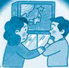
大雨の時は防災情報に注意!