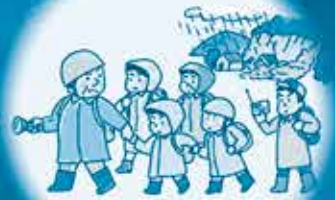
ご近所と声をかけあって、みんなで避難!