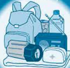
非常時の持ち出し品を確認!