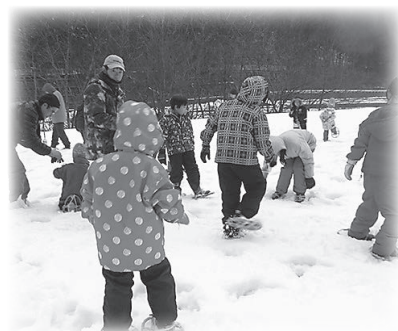
雪の中でかんじき体験！