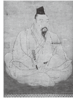
雪舟等楊「益田兼堯像」(部分)