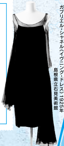
ガブリエル・シャネル「イヴニング・ドレス」(1925年) 島根県立石見美術館

Modern Synchronized and Stimulated Each Other The Polyphony of Function and Decoration