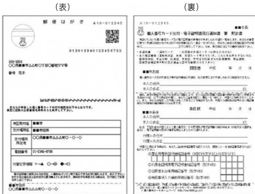
交付通知書（はがき）