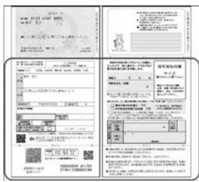
交付申請書 (通知カードの下部部分)

マイナンバーの通知カードと一緒に送付された交付申請書または、国の機関から送付されたQRコード付きの交付申請書をお持ちですか？