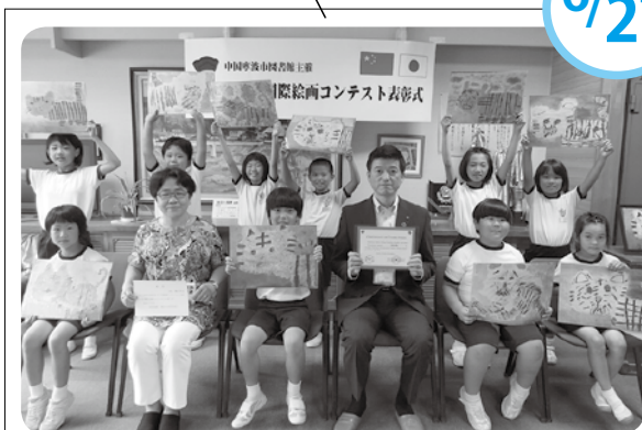
虎力全開！今年の干支「寅」を描きました