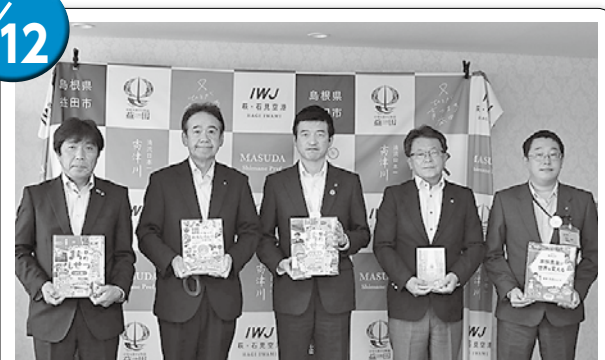
公益社団法人益田法人会様 児童・生徒の学習用図書 21冊を寄贈いただきました

【問い合わせ先】 市協働のひとづくり推進課 ☎ 31-0622 FAX 31-0641