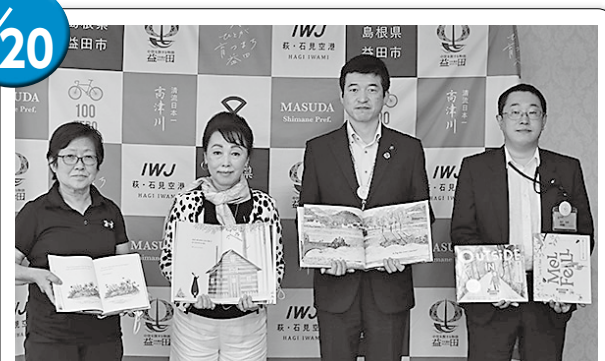
国際ソロプチミスト益田様 幼児・児童用英語絵本 9冊を寄贈いただきました