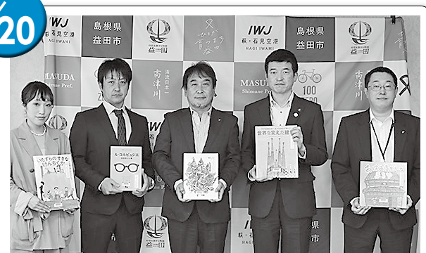
島根県建築士会益田支部様 建築に関する図書 22冊を寄贈いただきました