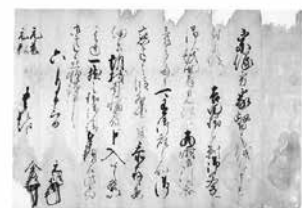
全鼎(益田藤兼)・益田元祥 連署書状(「肥後宗像家文書」 多良木町所蔵)