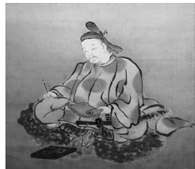
柿本人麿像 柳澤淇園筆 江戸中期 雪舟の郷記念館所蔵