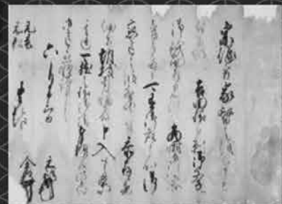
益田元祥・全船連署書状 多良木町所蔵