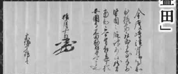
豊臣秀吉書状 多良木町所蔵