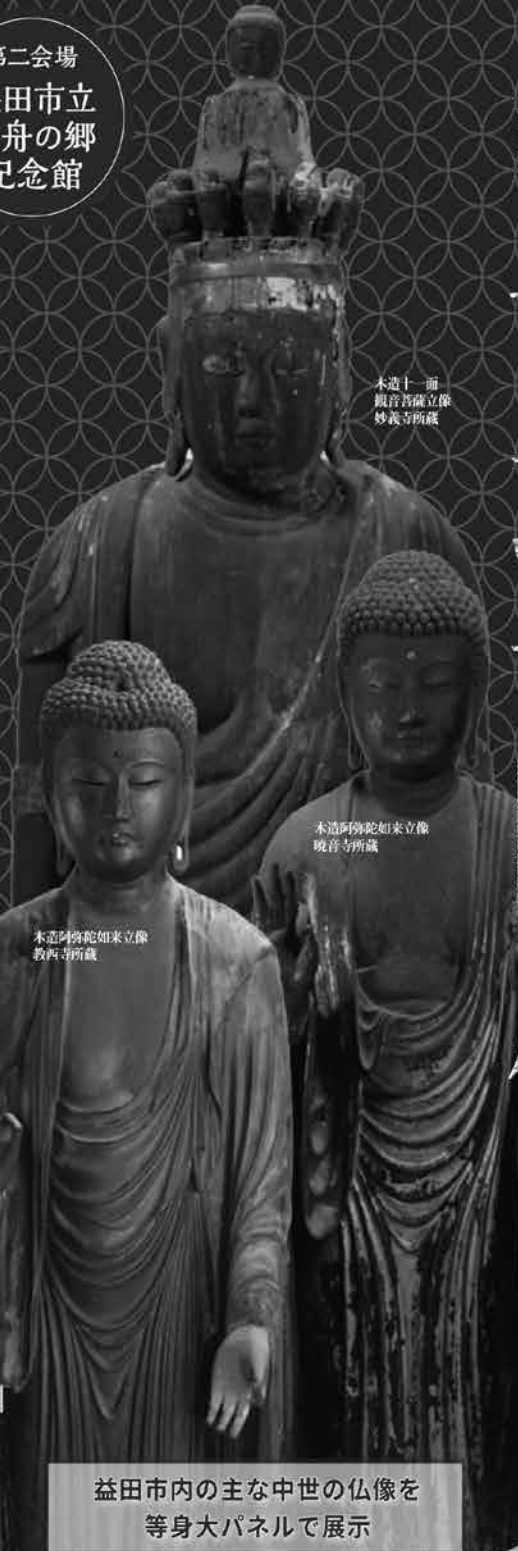
木造十一面 観音菩薩立像 妙義寺所蔵