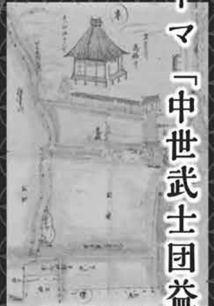
萬福寺境内図