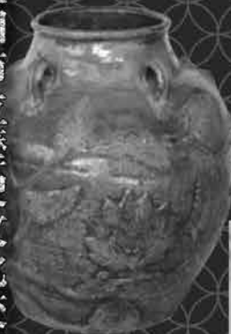
華南三彩貼花文五耳壺 萬福寺所蔵

益田市立雪舟の郷記念館 島根県益田市乙吉町イ 1149 ☎0856-24-0500