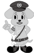
益田警察署マスコットキャラクター 「マッキーくん」

令和5年4月1日から施行される改正道路交通法により、自転車を運転するすべての人は乗車用ヘルメットをかぶるように努めなければなりません。