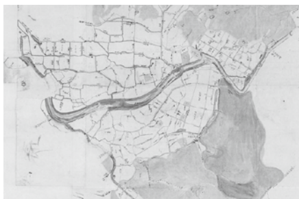
美濃郡上本郷村道水路図(部分。益田市所蔵)