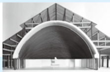
内藤廣《Unbuilt No.17》 2012年

Built(ビルト=建設された建物)とUnbuilt(アンビルト=実現しなかった建物)をテーマに、初公開資料も多数まじえ、グラントワの設計者、内藤廣の作品と思考を紹介します。