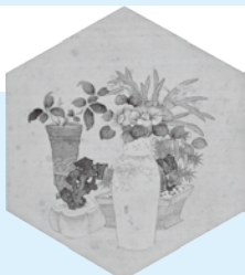
山本栞谷《盛花図》 『山水花鳥雑画帖』36面の内 明治時代・19世紀 東京国立博物館蔵

幕末から明治初めにかけて活躍した津和野藩の絵師、山本栞谷(きんこく)(1811-1873)の初期から晩年までの画業を紹介します。あわせて、江戸時代の津和野をいどった絵師たちの作品も展示します。