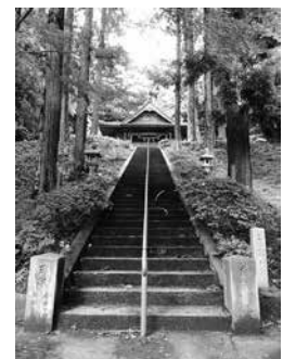
神寶山八幡宮 (美都町仙道)