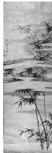
斎川芳畹「墨竹図」個人蔵