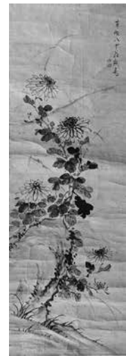
斎川芳畹「墨菊図」個人蔵