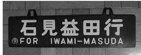
鉄道グッズ（行先板）