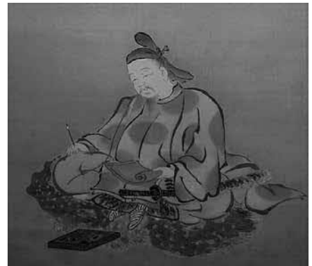
柿本人麿像 柳澤淇園筆 江戸中期 雪舟の郷記念館所蔵

故矢富厳夫先生の功績を顕彰し、石陽講座の資料や研究誌、益田の歴史文化に関する矢富先生の蔵書を紹介します。