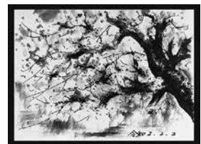
オリジナルカード「桜」