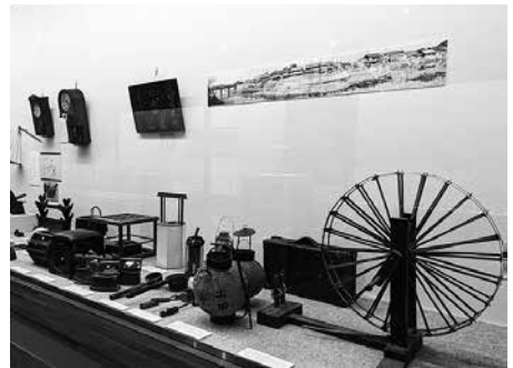
「むかしの暮らし」展示の様子