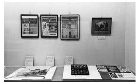
「わが家の宝もの展」展示の様子