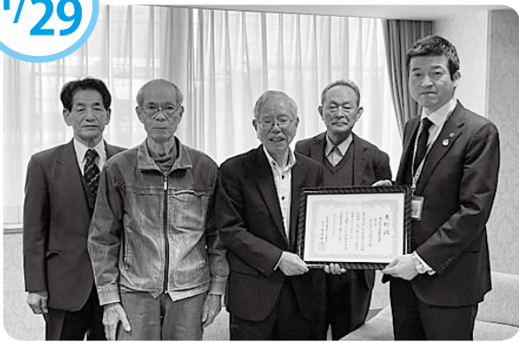
子どもたちの喜ぶ姿が力になっています