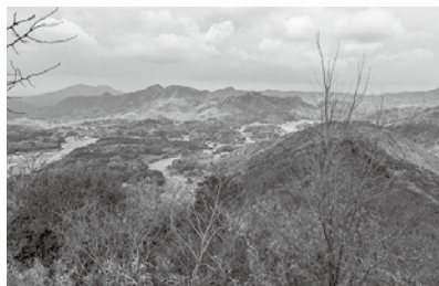
横山城本丸跡から北側の眺望 抜群の眺望で、敵が攻めてきてもすぐに気づくことができます。

現在の横山城跡は、地元の方が整備されていて、特に北側の眺望がすばらしく、麓はもちろん、益田平野まで見渡すことができます。見どころは本丸東側の4連続の堀切で、堀切の防御機能がよくわかります。