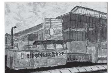
福原 颯太さんの作品