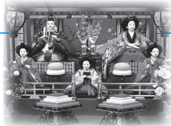
ひな人形展(昨年の様子)

皆さんは最近、ひな人形を飾っていますか？女の子の成長を願って、桃の節句に飾られるひな人形。もうずいぶん長い間、箱にしまったまま…という家庭も多いのではないのでしょうか。資料館では、皆さんのひな人形を展示する企画展を開催します。この機会に眠っているひな人形を資料館に展示しませんか。ひな人形の種類や大きさ、年代は問いません。数が全部揃ってなくても結構です。資料館までお持ちいただければ、展示作業は全て当館職員が行います。