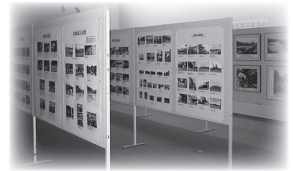
これまでの「ふるさと写真展」より

歴史民俗資料館では「益田」を写した写真を募集しています。私たちのふるさと益田を記録し後世に伝えていくために、明治・大正・昭和初期の古い写真から、最近の風景や行事を写した写真まで、あらゆる益田の写真を収集しています。益田の自然、街並み、祭り、地域行事、公民館活動などを撮影した写真をお持ちの方はぜひ、写真または画像データを当館までお持ちください。写真は全てデータ化して当館にて保存します。市民の方だけでなく、市外県外を問わずどなたでも応募いただけます。皆さんのご協力をお願いします。★締切：1月29日(月)