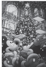
ディズニーアート コレクション