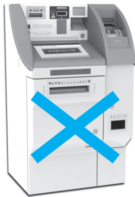
自動交付機は廃止しました

マイナンバーカードの申請については、広報ますだ平成29年6月号または市ホームページに掲載しています。マイナンバーカードを申請いただき、ぜひコンビニ交付をご利用ください。