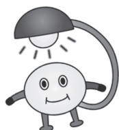
6年1組 ピカまるくん