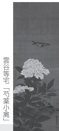
雲谷等宅「芍薬小禽」

花鳥画は草花や鳥など自然のモチーフを華麗に彩られたものというイメージが強いと思いますが、よく見ると水墨で描かれたモノクロームの世界の中にも色彩を感じることができます。それは想像の中で自由に楽しむことのできる“色”です。ぜひこの機会に、色彩豊かな花鳥画と、落ち着いた水墨による花鳥画を楽しんでみてはいかがでしょうか。