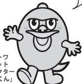
グラントワマスコットキャラクター「オロチくん」