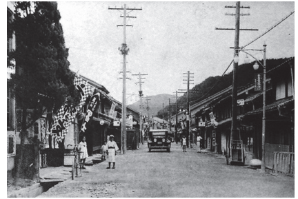
益田町本町通り(昭和初期)