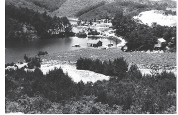
高津 蟠竜湖 (昭和 30 年代)