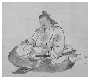
柳澤淇園「柿本人麻呂」(部分)

万葉集最高の歌人と称され、歌聖と仰がれている柿本人麿。伝承の人ともいわれ、その全体像は今も不明です。この企画展では、人麿の伝承や歌を紹介しながら、時代を経て様々に描かれた人麿像を展示し、その謎多き生涯に迫ります。また、石陽講座 X 第 28 回「人麿伝説」の講座資料も当館にて好評販売中です。