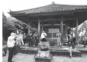
第 8 回ぶら雪舟の様子

ました。当日は益田観光ガイド友の会のガイドさんの分かりやすい解説のもと、楽しむことができました。当日の様子は当館ホームページで紹介していますので、ぜひご覧ください。