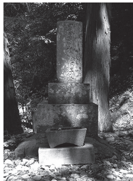
岸静江国治の墓 (染羽町)

★会期中ご入館の方に「やまぐち幕末 ISHIN 祭トレーディングカード」をプレゼント！