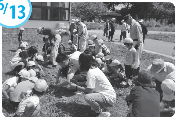
きれいな花を咲かせてね！