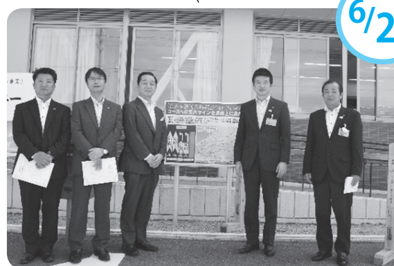
市役所前に案内看板が設置されました