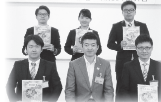
平成30年度 益田市地域医療連携会議 ～市民・病院・議会・行政関係者～ 平成30年6月1日

その後の交流会では、県外から赴任して勤務する意気込みを、研修医からは地元で勤務できる喜びを聞くことができました。