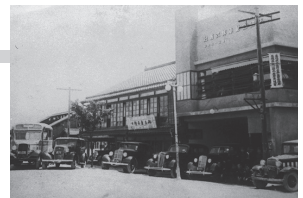
益田駅前（昭和 30 年代）