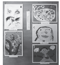
特別雪舟賞受賞作品 5 点

益田市雪舟顕彰会が毎年開催している幼児の絵画展の表彰式が、6月3日(日)大喜庵で行われました。現在、特別雪舟賞に輝いた作品 5 点を展示しています。元気いっぱいいきいきとした作品をぜひご覧ください。