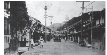
益田町本町通り（昭和初期）