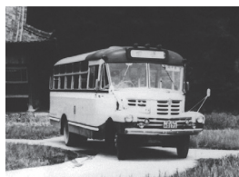
染羽天石勝神社舞殿と ボンネットバス

8月、益田の昔の写真と現在の町並みや風景とを見比べながら、昔と今で変わったところ、変わらないところを探しながら歩きます。大人から子どもまで、どなたでも参加できます。小学生以下の方は、保護者の方と一緒にご参加ください。厳しい暑さが予想されますので、熱中症対策をお忘れなく！