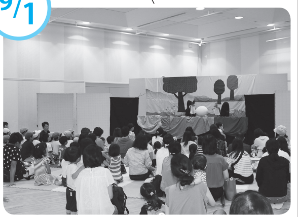
人形劇「ぐりとぐら」にみんな夢中！