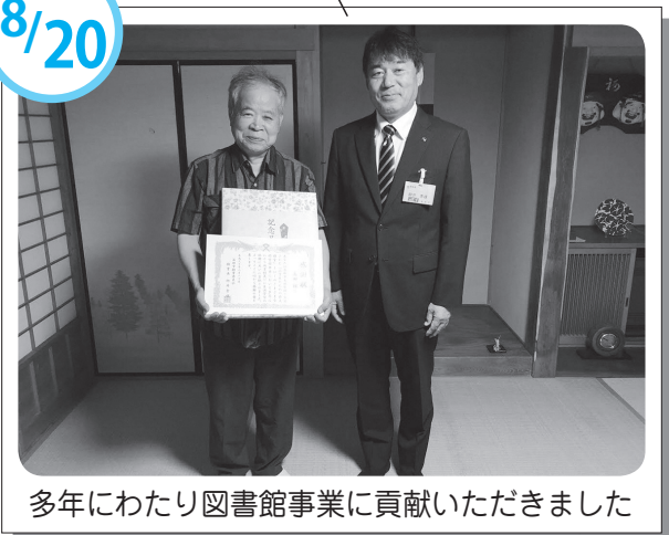
多年にわたり図書館事業に貢献いただきました