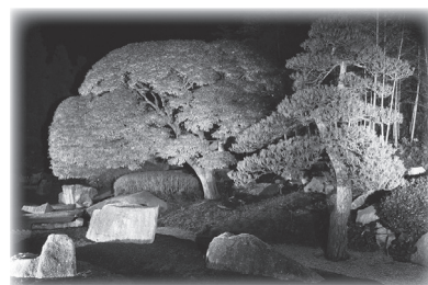
八景園ライトアップ