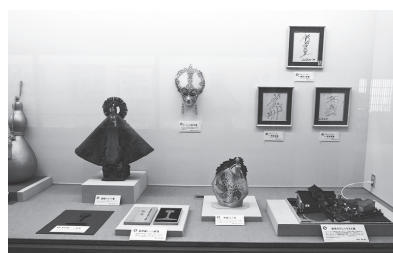
第8回の様子(資料館)

★資料館ホームページに第1回からの出品目録「お宝図鑑」を掲載中！ http://www.iwami.or.jp/rekimin/