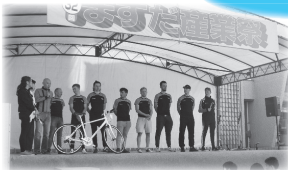
ますだ産業祭にてステージ出演