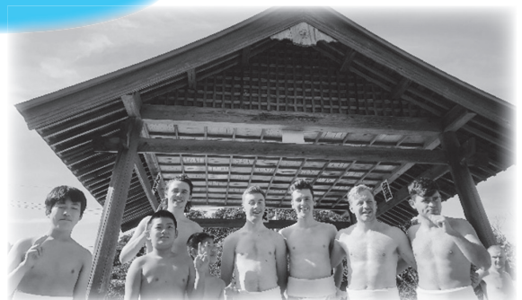
子どもたちとの相撲交流