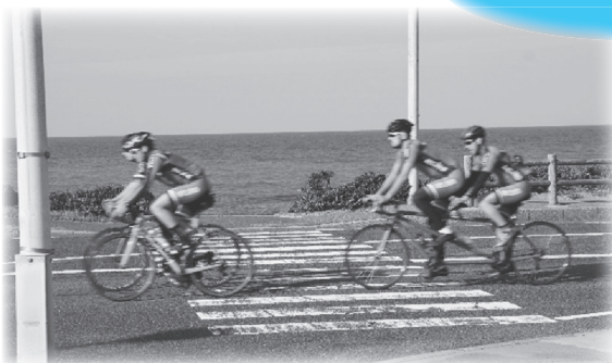
2人乗りタンデム自転車の練習風景