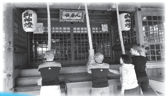
高津柿本神社参拝