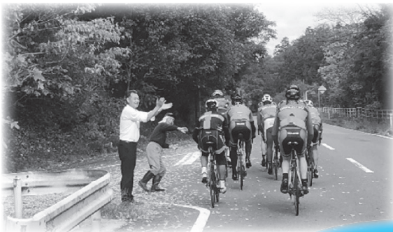
沿道での市民からの声援