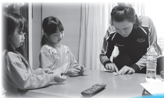
市民のお宅にホームステイ

キャンプ期間中、車輛の通行や治道でのご声援、市民との 交流にご協力いただき、誠にありがとうございました。