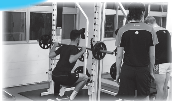
トレーニングジムにて

〔平成30年11月6日〜11日〕 アイルランド自転車競技選手団が 益田市でトレーニングキャンプを実施しました！