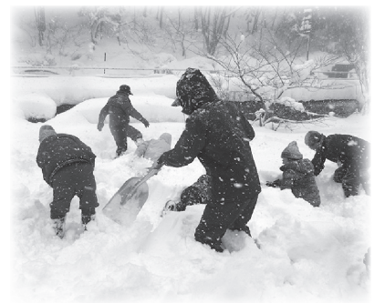
雪の中の宝探し(昨年の様子)