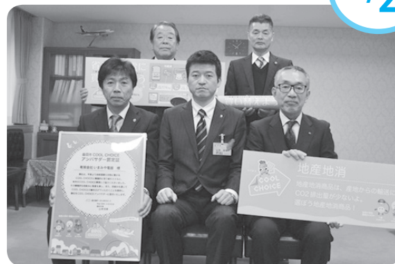
身近なところから「クールチョイス」を！