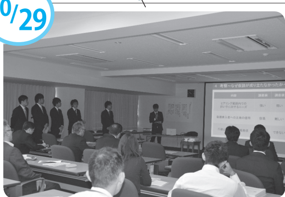
フィールドワークの成果を発表しました！