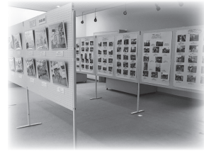
昨年の「ふるさと写真展」より

歴史民俗資料館では、益田の写真を集めています。私たちのふるさと益田を記録し後世に伝えるために、明治・大正・昭和初期の古い写真から、最近の風景や行事を写した写真まで、様々な益田の写真を収集しています。撮影時期は問いません。益田の自然、街並み、祭り、地域行事、公民館活動などを撮影した写真をお持ちの方はぜひ、写真または画像データを当館までお持ちください。写真は全てデータ化して当館にて保存します。市民の方だけでなく、市外県外を問わずどなたでもご応募いただけます。今年度お寄せいただいた写真は、2月10日(日)から始まる企画展「第15回ふるさと写真展」にて展示公開します。皆様のご協力をお願いします。