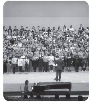
「グラントワ・カンタート2018」より

2019年の幕開けに、日本各地、韓国、中国から合唱団が島根に集う! 総勢500名の迫力ある歌声をぜひお聴きください。