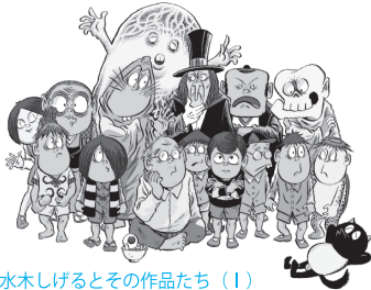
水木しげるとその作品たち(1) 2010年頃

2015年に亡くなった漫画家、水木しげるの回顧展。妖怪漫画の原画のほか、戦地で描いたスケッチ、世界中で収集した精霊や妖怪の仮面などにより、水木しげるの人と作品の魅力に迫ります。