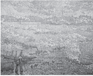
ポール・シニャック 《ロッテルダム、蒸気》1906年 島根県立美術館蔵

島根県内にある美術作品をく点と線、くかたち、く色などのさまざまな要素からわかりやすく紐とき、美術の基本を楽しく紹介します。あわせて島根県内の文化財も展示し、地域に根差した文化に触れる機会とします。