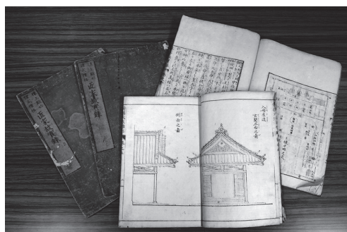
寄贈資料「新撰大匠雛形大全」