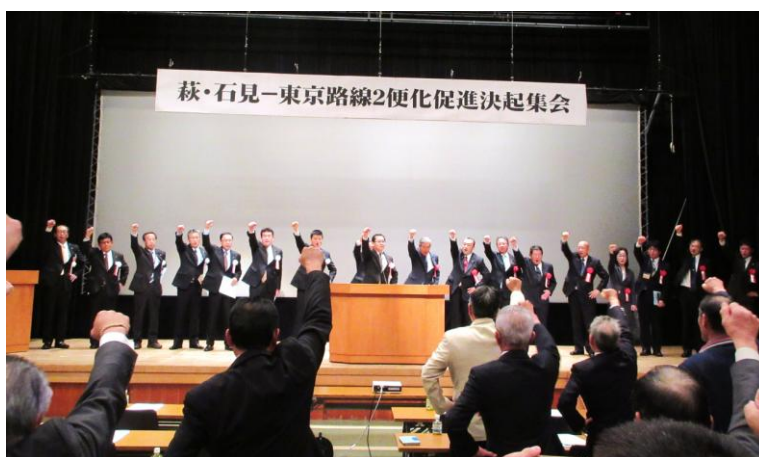
【 萩・石見-東京路線2便化促進決起集会（平成27年11月開催） 】

つきましては、本市としましても、萩・石見空港利用拡大促進協議会と連携し、引き続き利用者増に向けた取り組みを積極的に行ってまいりますので、県においても、昨年度に引き続き、県西部を中心とした首都圏での観光キャンペーン、全国大会等コンベンションの誘致、企業誘致活動の促進、二次交通対策の充実をはじめ、各種の会議・研修会等を県西部で開催していただくなど、県行政各般を通じて萩・石見空港の利用拡大につながる諸施策を集中的に推進していただきますよう、特段のご配慮を要望します。