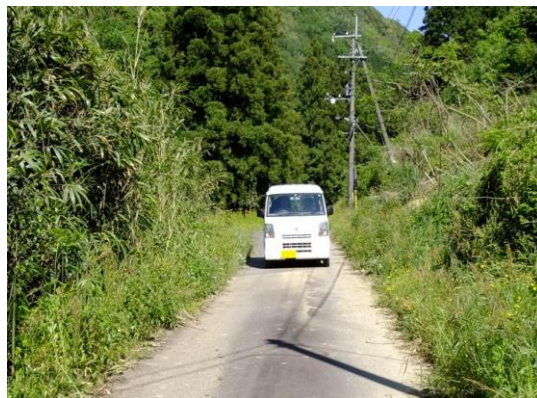
【 主要地方道三隅美都線未改良区間の状況 】 【 市道丸茂三隅線未改良区間の状況 】