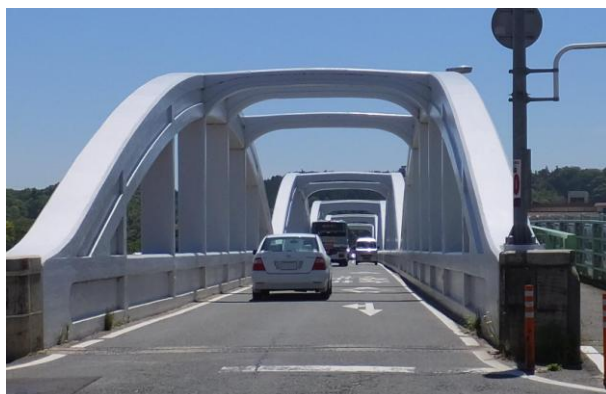
【 右：道路幅員の狭い高角橋の状況 】