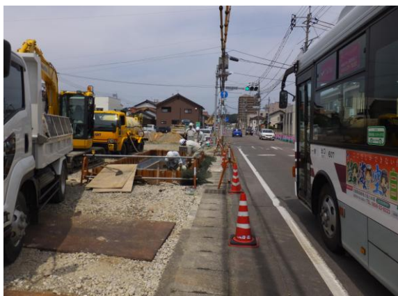
【 左：都市計画道路中島染羽線の施工状況 】

つきましては、中心市街地の発展と地域の活性化に資する都市計画道路中島染羽線の早期完成と、元町人麿線及び須子中線の早期整備を要望します。