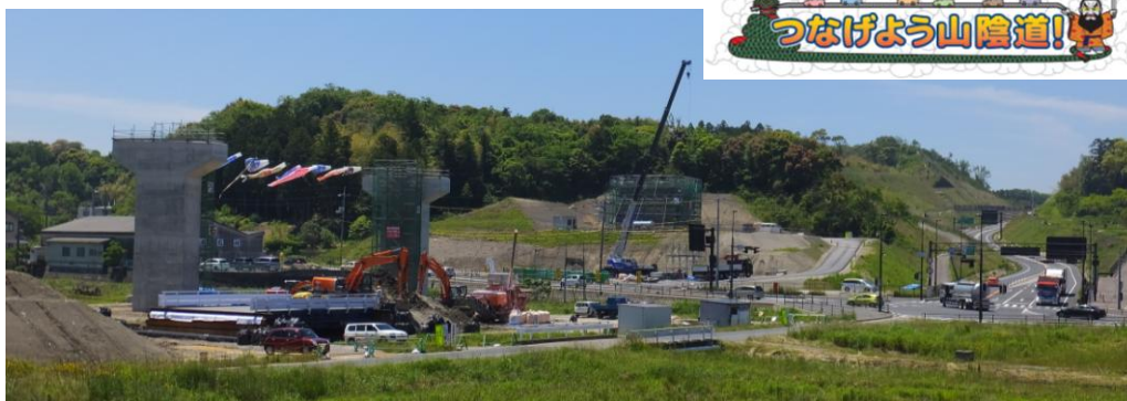
【 三隅・益田道路 遠田 IC 付近の施工状況 】

つきましては、地域の安全・安心を守り、地域経済の活性化と連携強化による一体的な発展を図るため、山陰道三隅・益田道路の早期整備と益田～萩間における早期事業着手、とりわけ小浜～田万川間の早期計画段階評価への移行について、国等関係機関へ働きかけていただきますよう要望します。