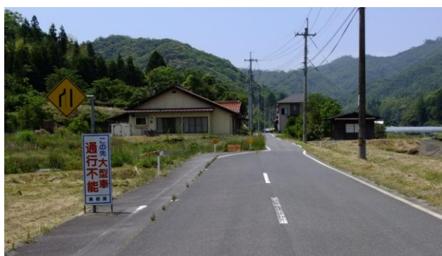
【 左：一般県道益田津和野線 未改良区間の状況 】