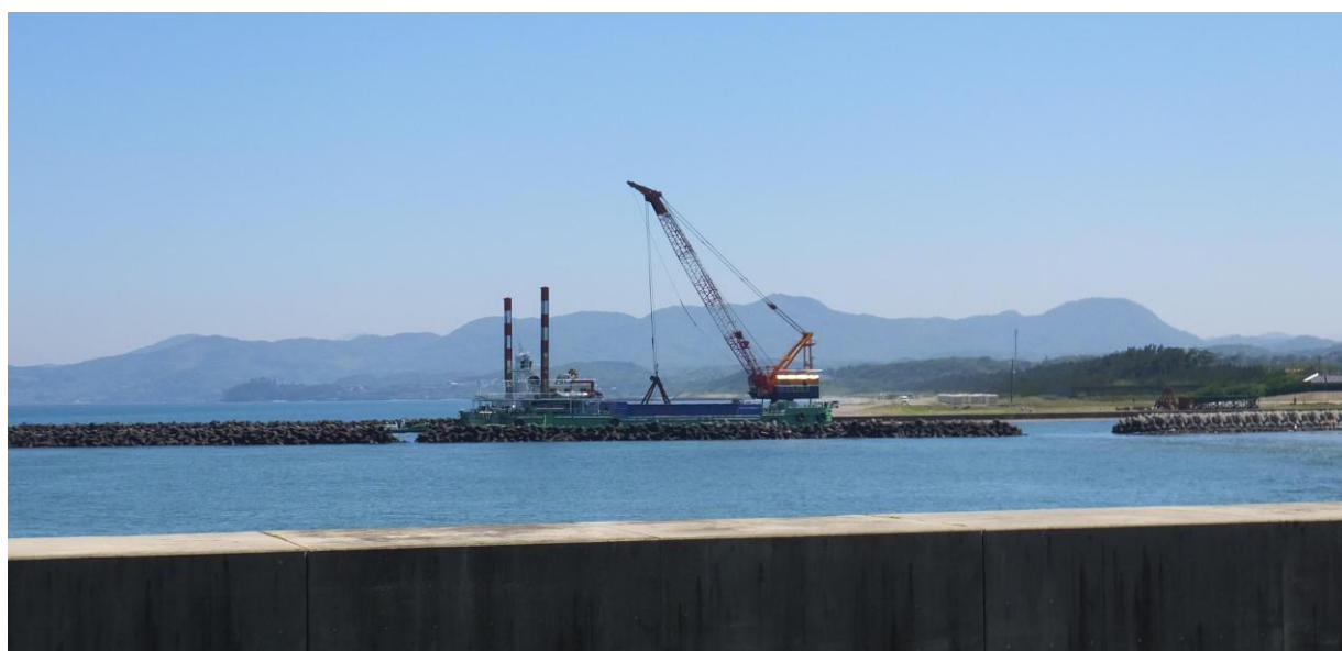
【 益田港の施工状況 】