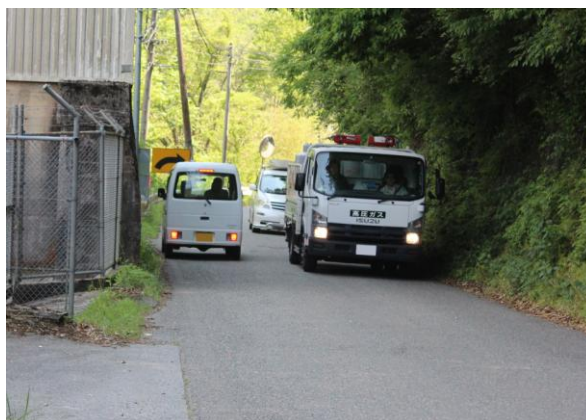
【 右：澄川地域の状況 】