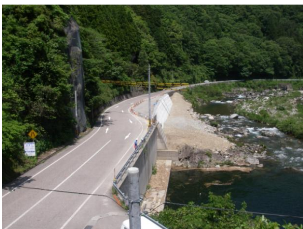
【 左：落合工区の整備状況 】

つきましては、一般国道488号の未改良区間の早期完成に向けて、取組みを進めていただきますよう要望します。