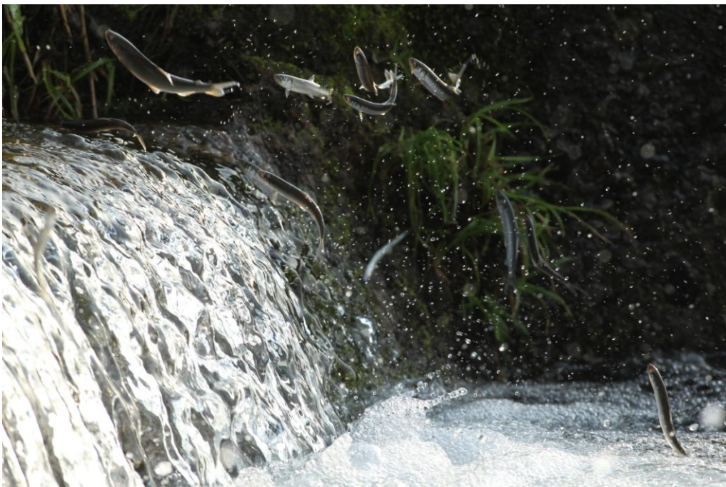
【 清流高津川を遡上する市の魚 『アユ』 】