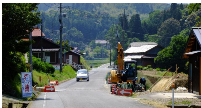
【 右：一般県道美濃地石見横田 停車場線の施工状況 】

併せて、一般県道益田種三隅線の東町工区改良工事につきましても早期完成を要望します。