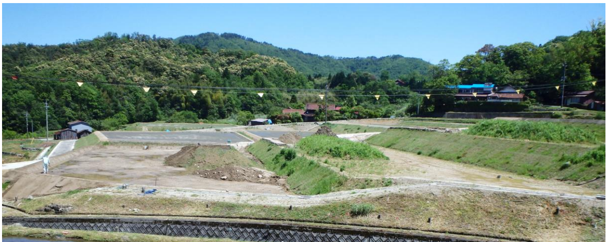
【 益田地区中山間地域総合整備事業 区画整理：久保溢 】

つきましては、現在県営農業農村整備事業で実施していただいている、益田地区農道保全対策事業（平成 22 年度着手：橋梁耐震化等）、益田地区中山間地域総合整備事業（平成 23 年度着手：区画整理・用排水施設・暗渠排水・鳥獣害防止柵等）、高津川左岸地区農業水利施設保全合理化事業（平成 27 年度着手：用水機場等の更新）及び今後実施が予定されている地すべり防止事業、ため池等整備事業について確実な進捗・実施が図られるよう、予算の確保を要望します。