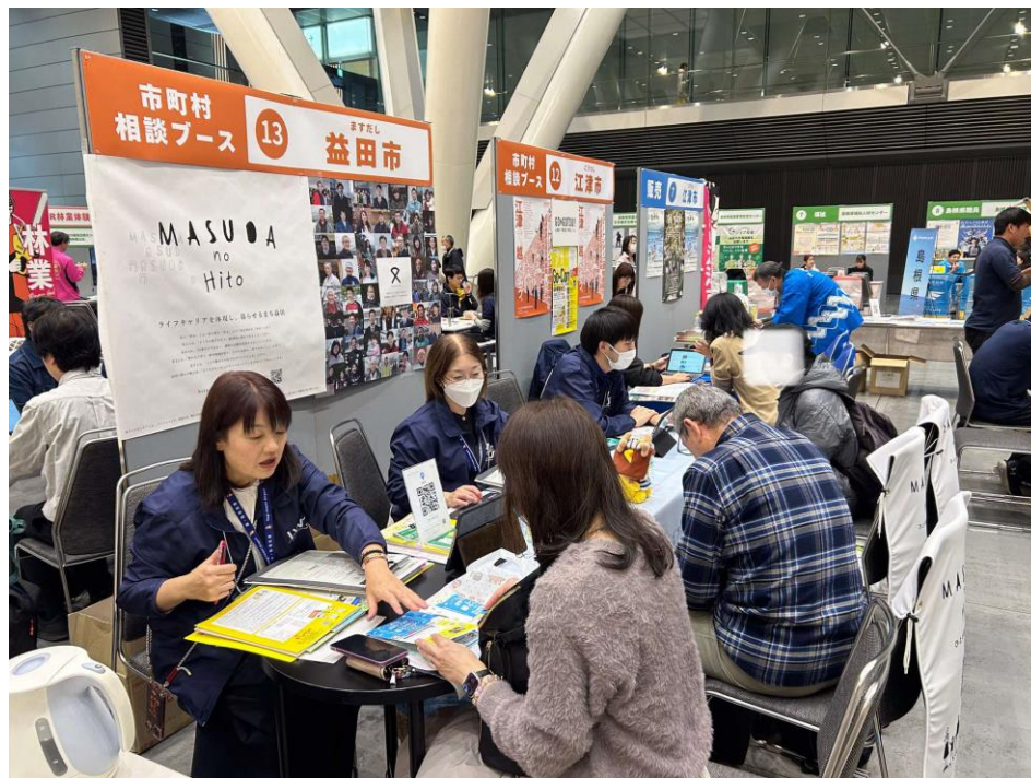
【移住フェアの様子】

ります。つきましては、本事業を始め国に対して積極的な地方への移住施策の展開を働きかけていただきますよう要望します。