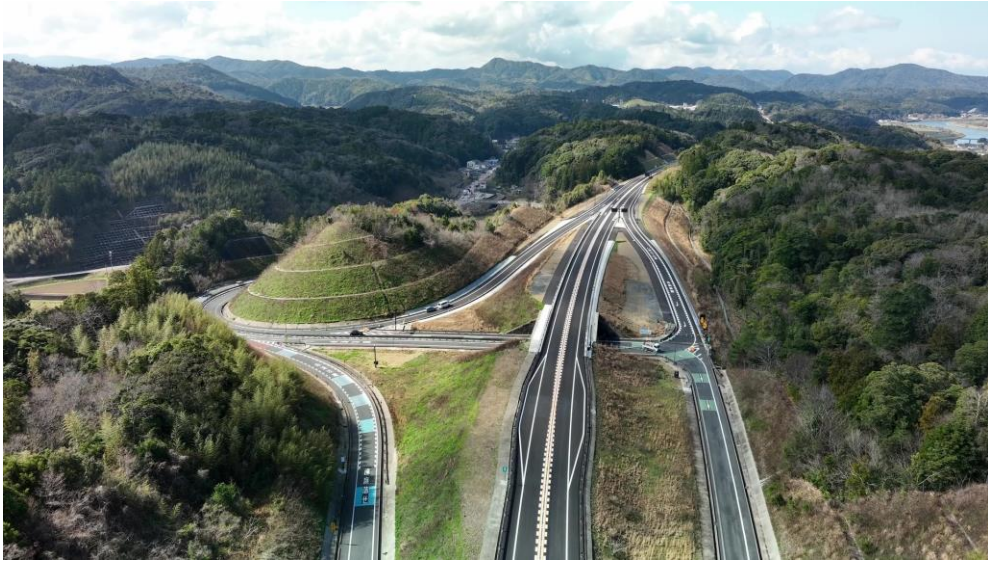
【山陰道 三隅・益田道路（石見三隅）】