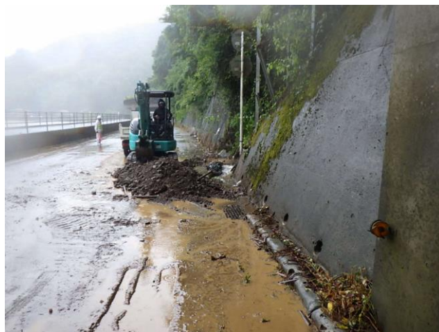
【一般国道 9 号の事前通行規制区間（土砂流出状況）】