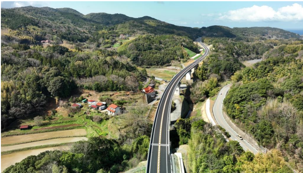
【山陰道 三隅・益田道路（馬橋高架橋）】