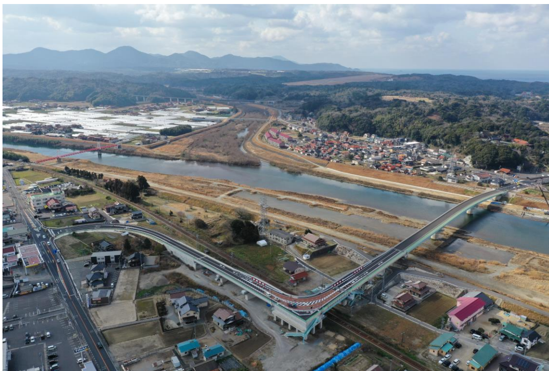
【都市計画道路元町人麿線】

つきましては、中心市街地の発展と地域の活性化に資する都市計画道路元町人麿線の早期整備並びに全線開通を要望します。