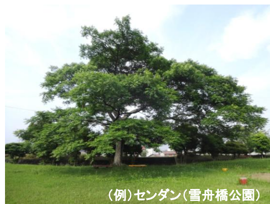
(例)センダン(雪舟橋公園)

※景観重要建造物及び景観重要樹木の指定を受けた建造物及び樹木については、市長の許可を受けなければ、現状変更(建造物については、増改築・外観の変更等。樹木については、伐採・移植。)を行うことができません。