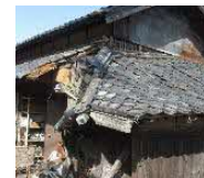
緊急代執行を要する 崩落しかけた屋根