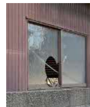
窓が割れた 管理不全空家