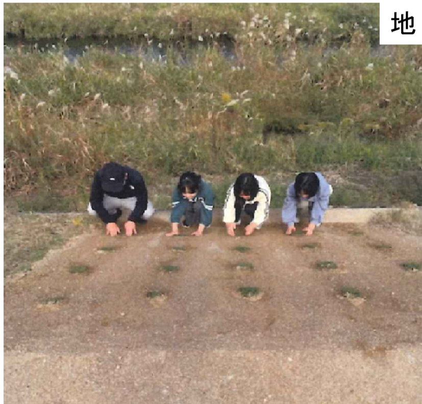
益田川土手景観試験活動