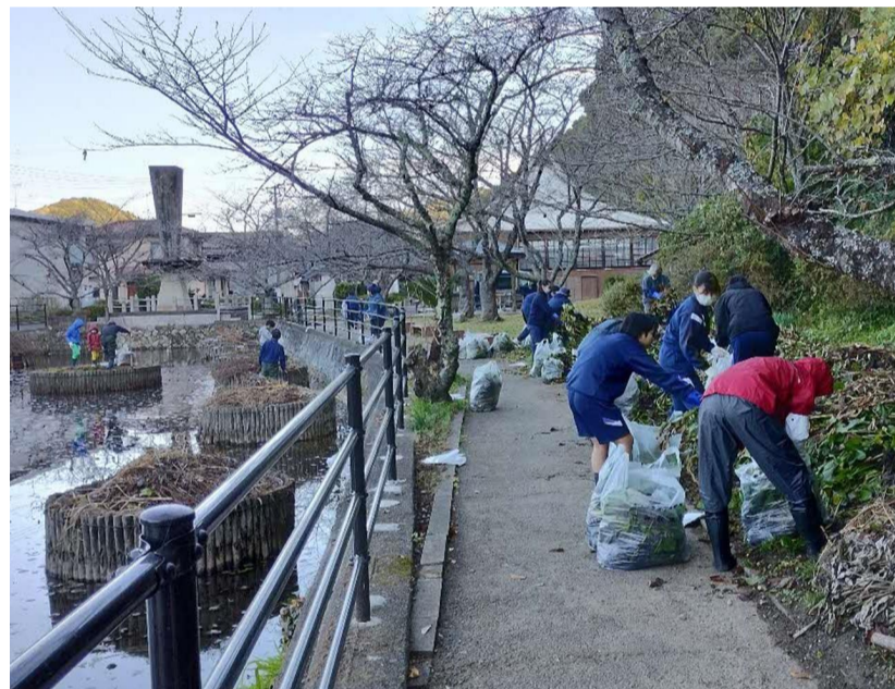
住吉神社“池”そうじ大作戦