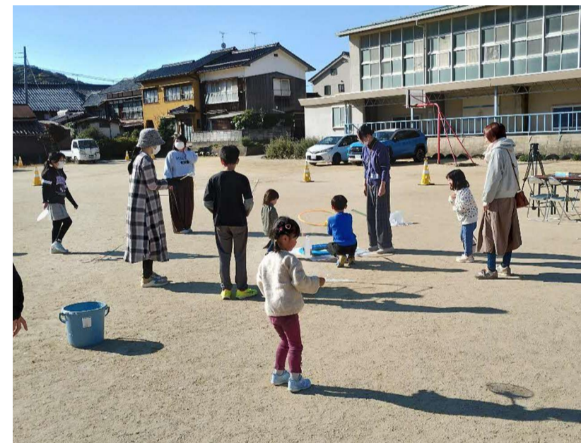
プレーパークin校庭 ～巨大シャボン玉を飛ばそう～