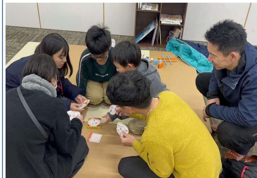
つろうて来んちやいデー