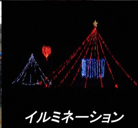
イルミネーション

美濃郡発祥の地であります美濃地区には、古代から豊かで深い歴史が底流をなし、多くの史跡や文化財などが奇跡のように残されています。